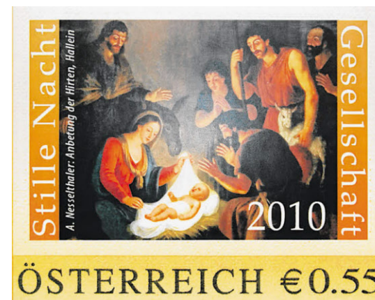
1900 Stück gibt es von der heurigen Stille-Nacht-Briefmarke, welche die „Anbetung der Hirten“ zeigt.