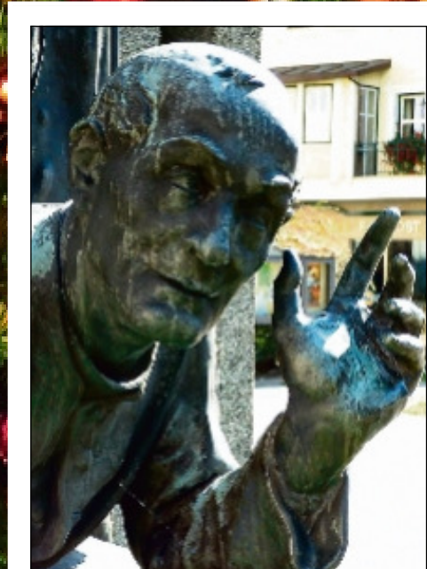
Eine Bronzefigur von Pastor Joseph Mohr.

Text: Joseph Mohr, 1816 Melodie (Komposition): Franz Xaver Gruber, 1818